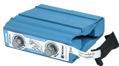
Wedge 및 We